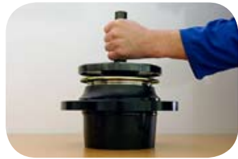
Fig. 5 · Colocación del útil premontaje