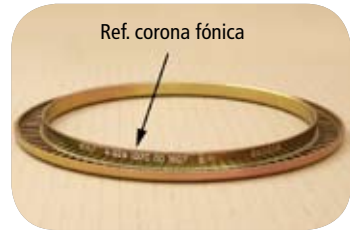
Fig. · Referencia de la corona fónica

La referencia de la corona fónica la puede encontrar grabada en el labio lateral (Fig. 1). Podemos encontrar 2 ref. coronas con 80 dientes ref. 04 029 1069 00 y otra con 90 dientes ref. 04 029 1070 00.