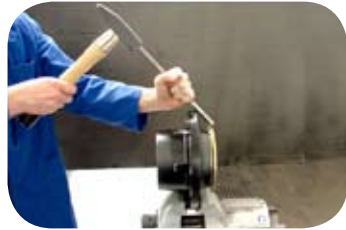
Fig. 3 · Desmontaje corona fónica