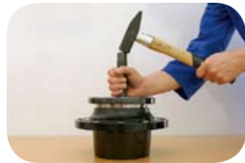
Fig. 6 · Inserción corona