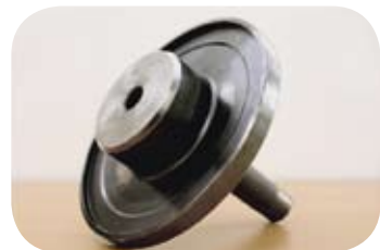
Fig. · Útil de montaje