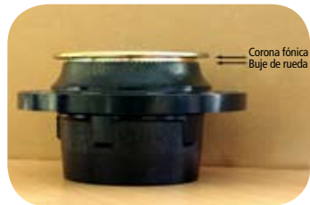
Fig. 7 · Correcta colocación de la corona