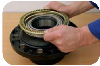
Fig. 4 · Colocación corona en el buje