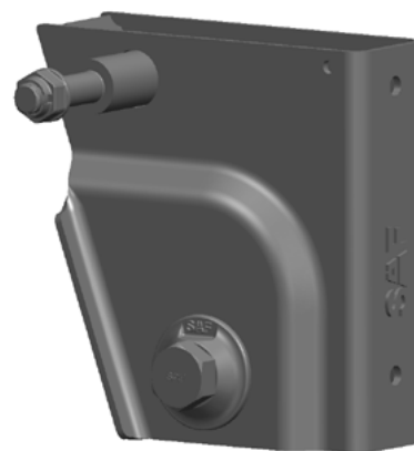
Vnitřní strana konzoly pérování