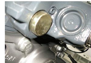
KNORR SN7: uzavřené ložisko DU

Příslušné sady náhradních dílů pro výše uvedené brzdy se rovněž předělají na nové kryty volného uložení.