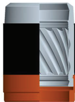
KNORR SN6: otevřené volné uložení